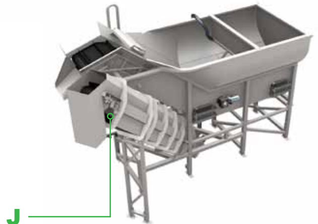
Receptor hídrico con eliminador de piedras Wyma – Elevador de piedras