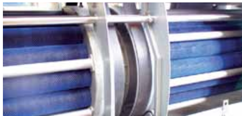
El tambor de transición permite un eficiente flujo de producto entre barriles