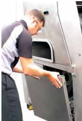
Puerta de salida