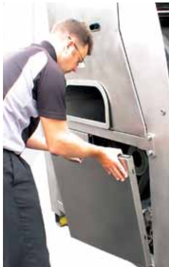
Portello di ispezione