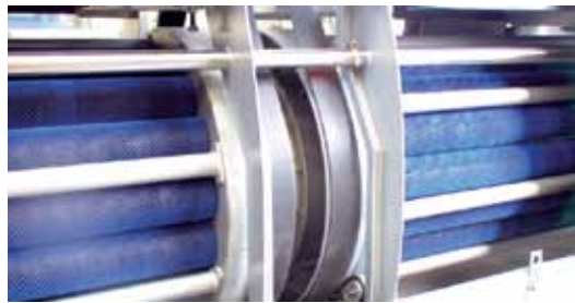
Tamburo di alimentazione, per un efficiente spostamento del flusso di prodotto tra i cilindri