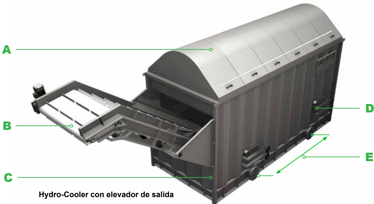
Hydro-Cooler con elevador de salida