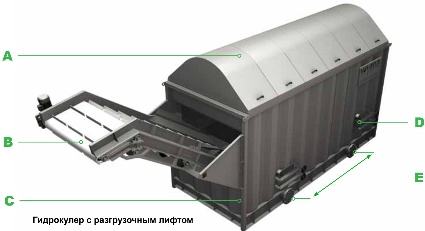
Гидрокулер с разгрузочным лифтом