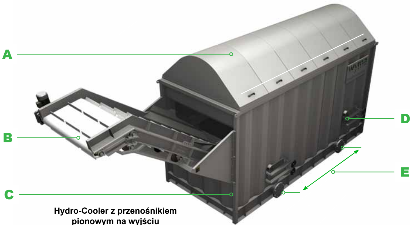
Hydro-Cooler z przenośnikiem pionowym na wyjściu