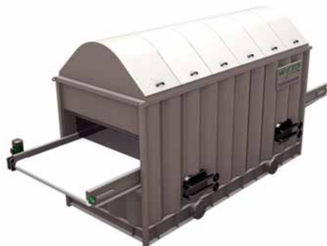
Hydro-Cooler z przenośnikiem 'na przelot'