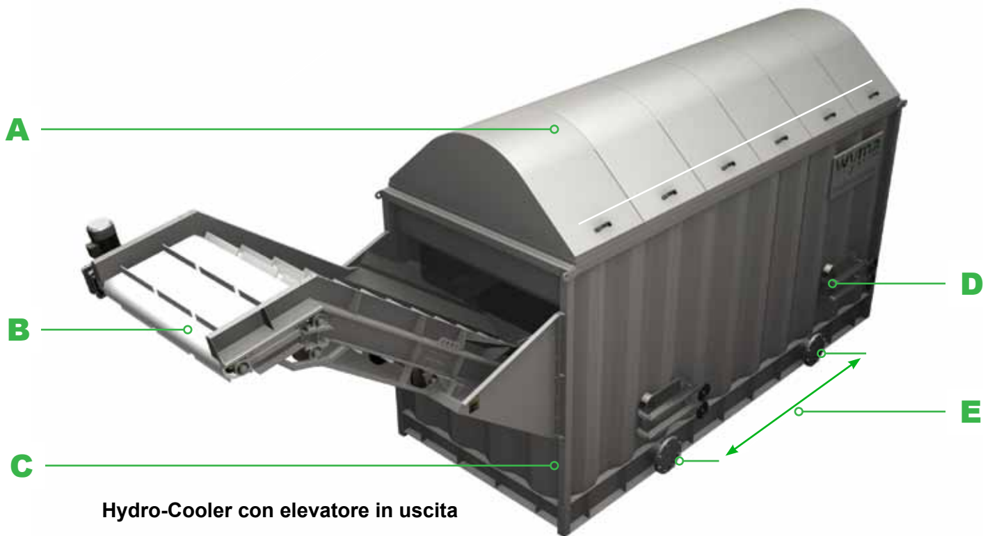
Hydro-Cooler con elevatore in uscita