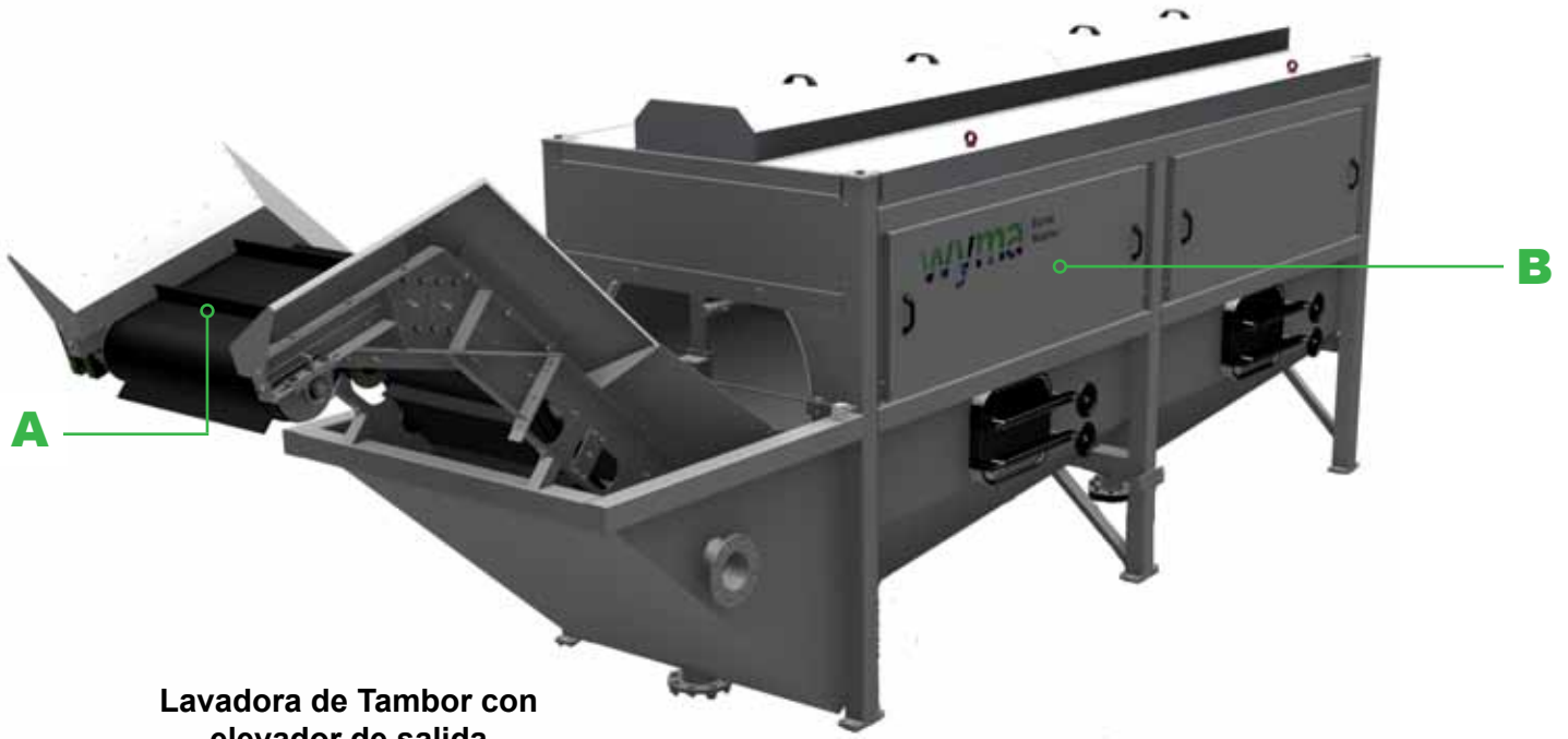
Lavadora de Tambor con elevador de salida