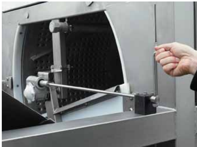
Puerta de salida