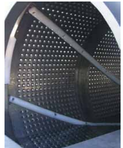
Tambor de interior perforado con barras agitadoras