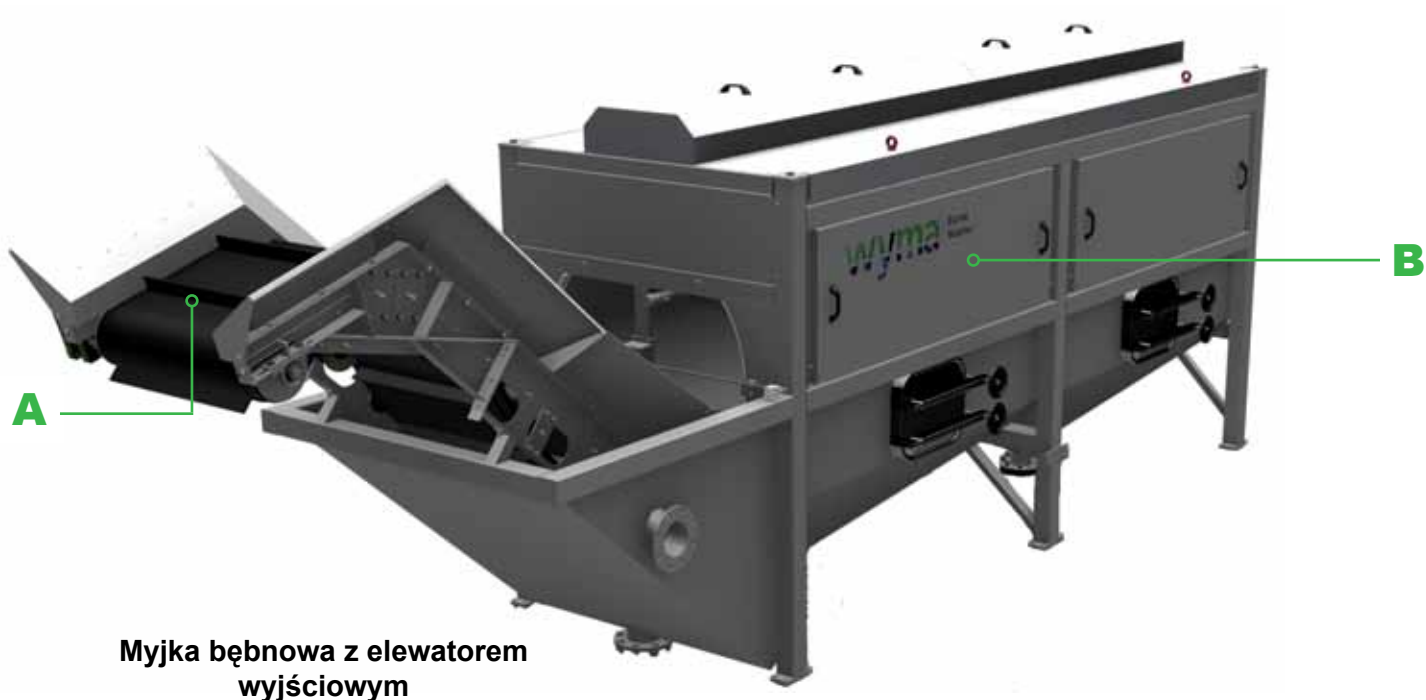
Myjka bębnowa z elewátorem wyjściowym