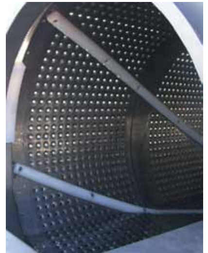
攪拌バー付きの内蔵穿孔ドラム