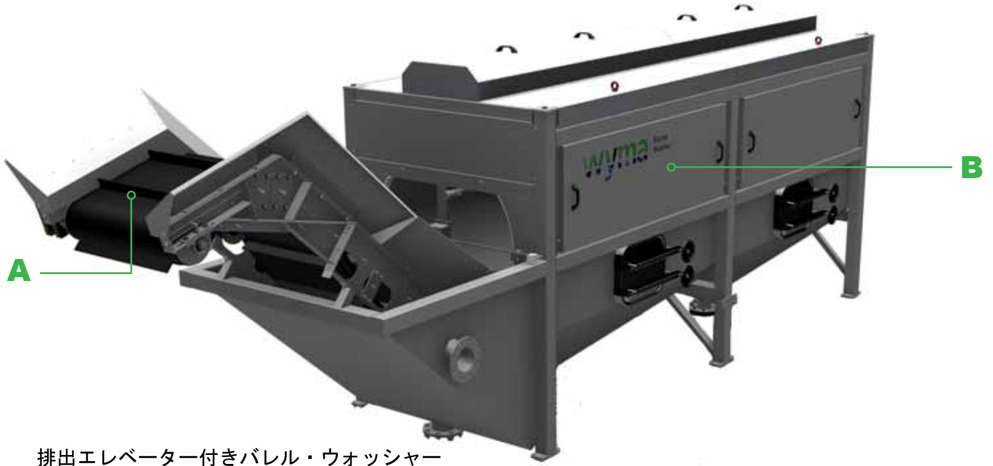
排出エレベーター付きバレル・ウォッシャー