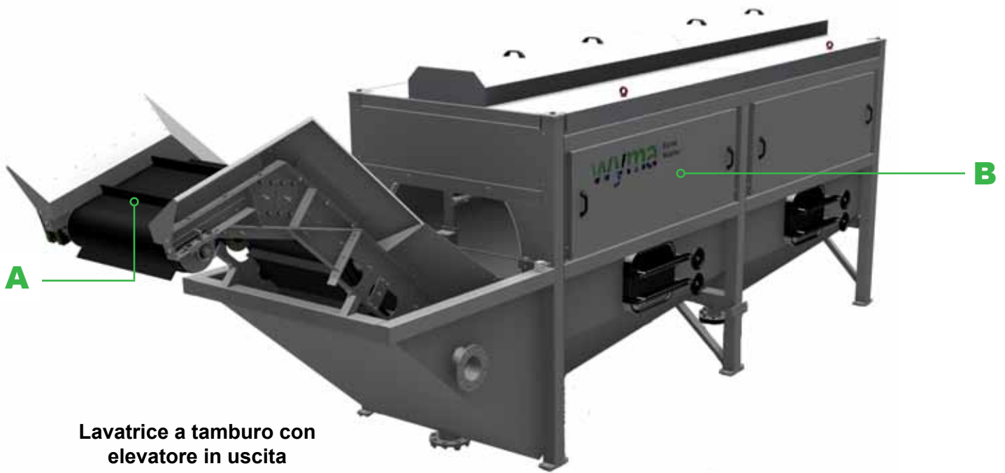
Lavatrice a tamburo con elevatore in uscita