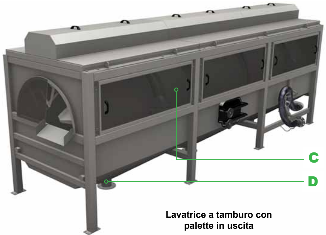
Lavatrice a tamburo con palette in uscita