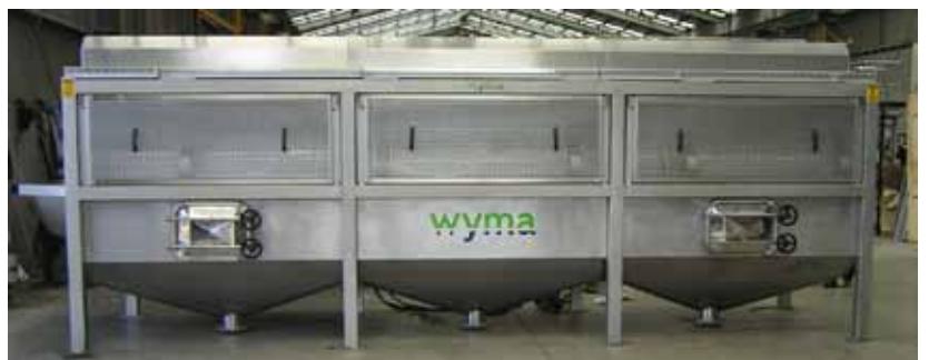
Lavatrice a tamburo Wyma da sei metri in acciaio inossidabile, con palette in uscita

Per assicurare una movimentazione delicata del prodotto in uscita la lavatrice a tamburo offre la possibilità di scegliere tra palette o sollevatore in uscita sommerso.* Per ottenere risultati ottimali, la lavatrice a tamburo viene solitamente seguita sulla linea di produzione dall'attrezzatura Vege-Polisher™ di Wyma.