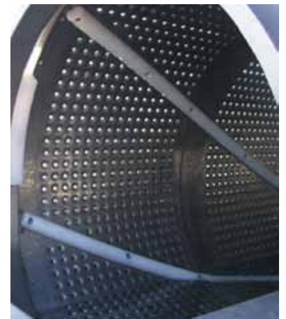
Tamburo perforato interno con barre agitrici