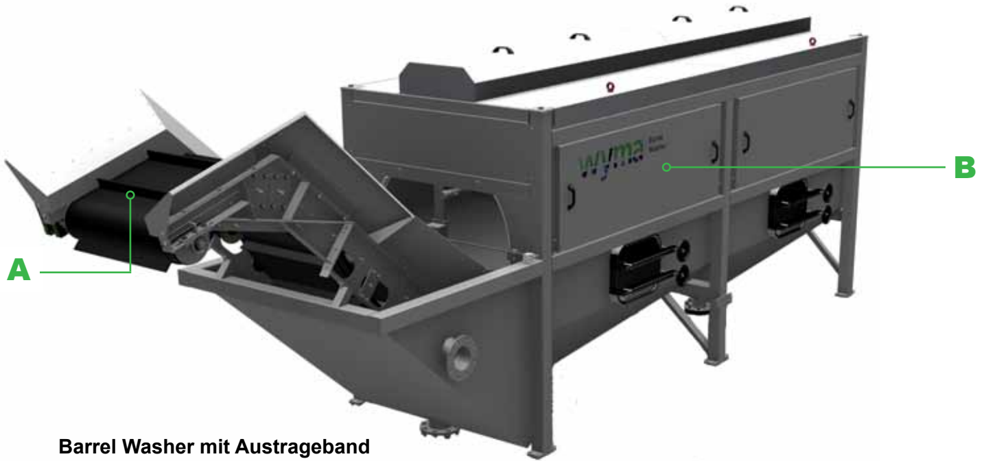
Barrel Washer mit Austrageband