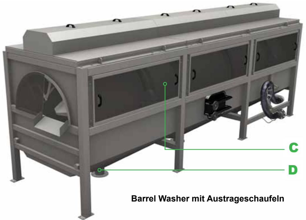
Barrel Washer mit Austrageschaufeln