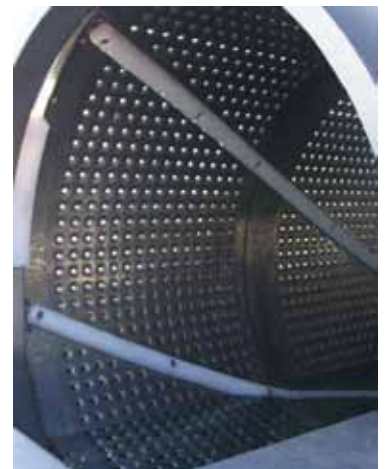
Innenraum der perforierten Trommel mit Rührarmen